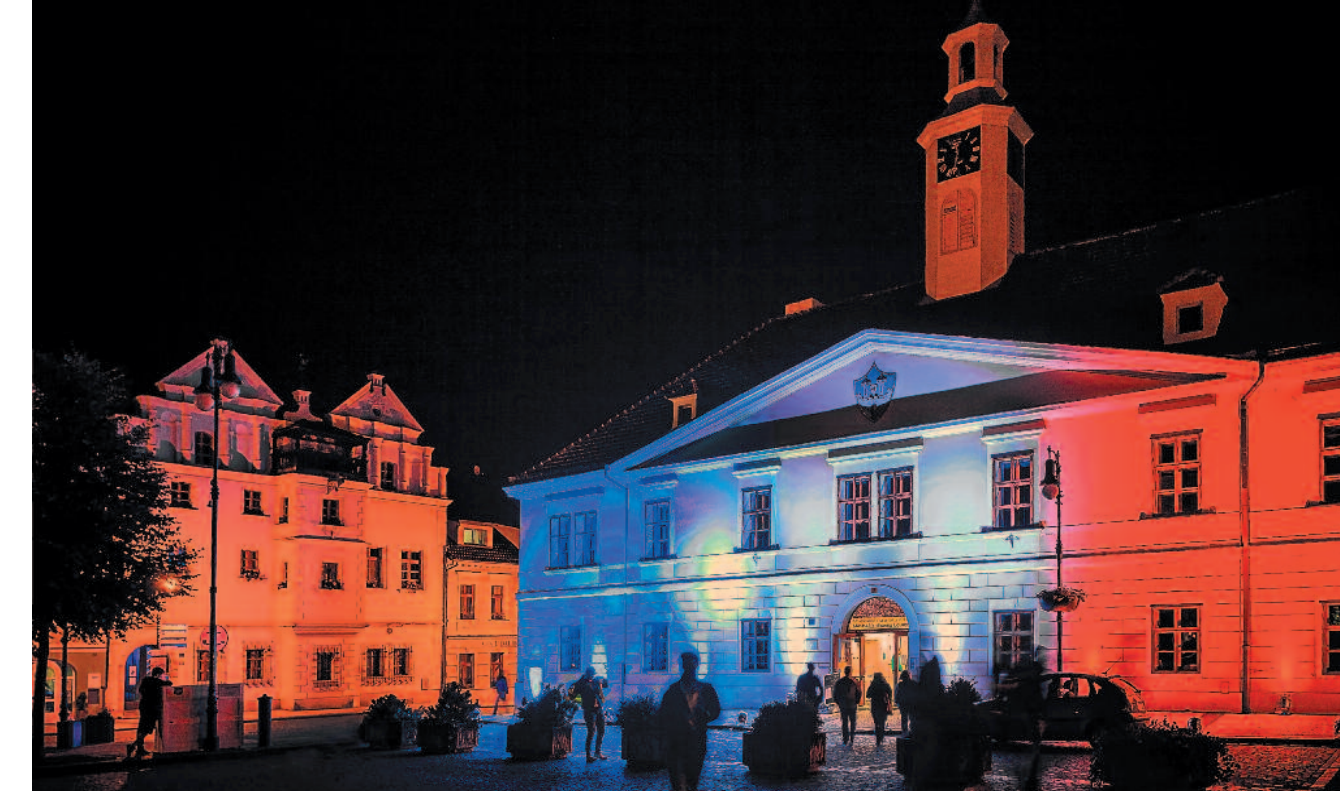
František Bartoň: Městská knihovna nasvícená do barev francouzské trikolóry