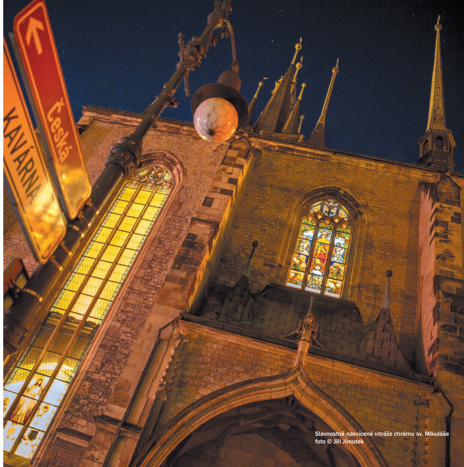
Slavnostně nasvícené vitráže chrámu sv. Mikuláše