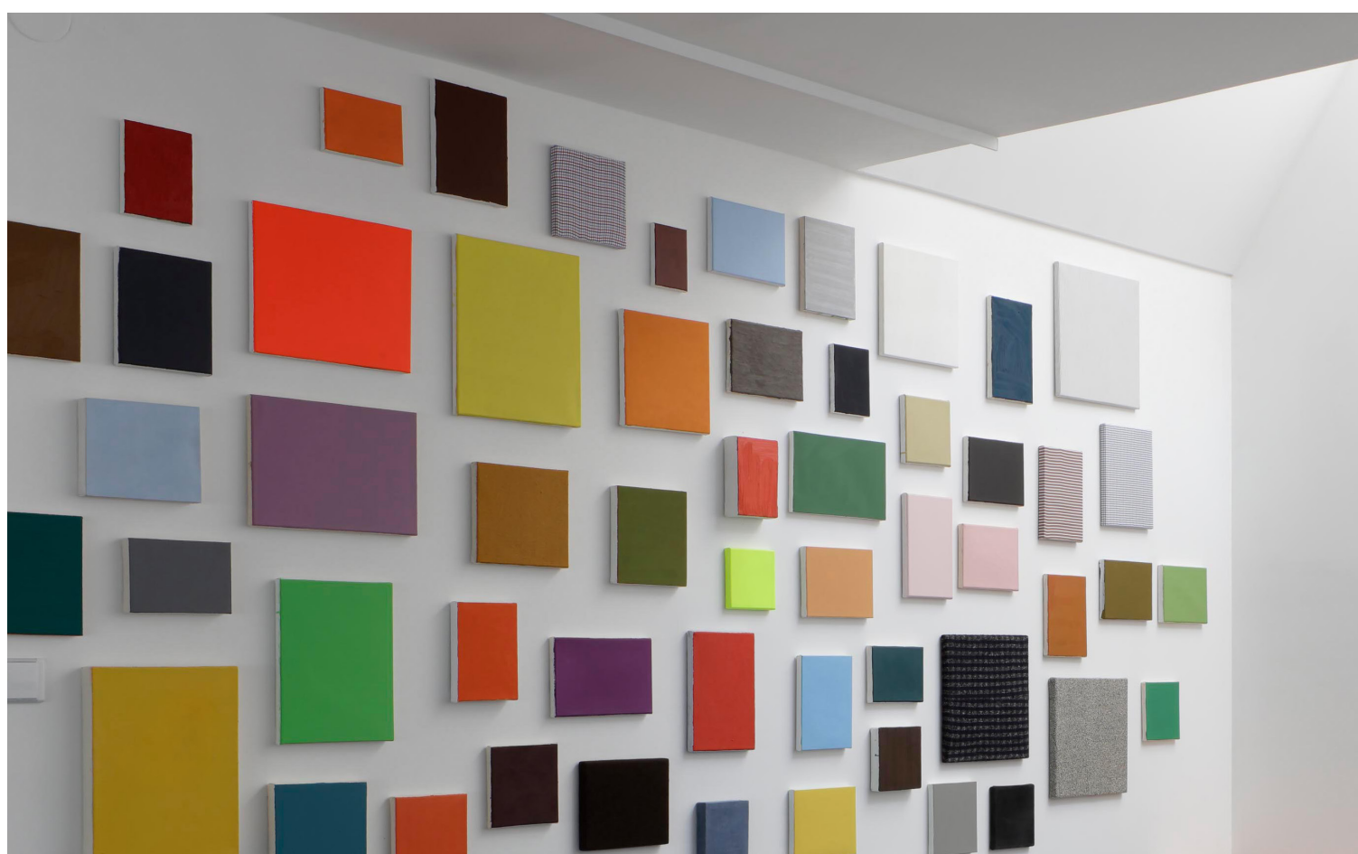
Jan Smejkal / sen za titolo / Výběr z třistašedesáti objektů / část rozsáhlejšího souboru / 2000–2020 / mixed media